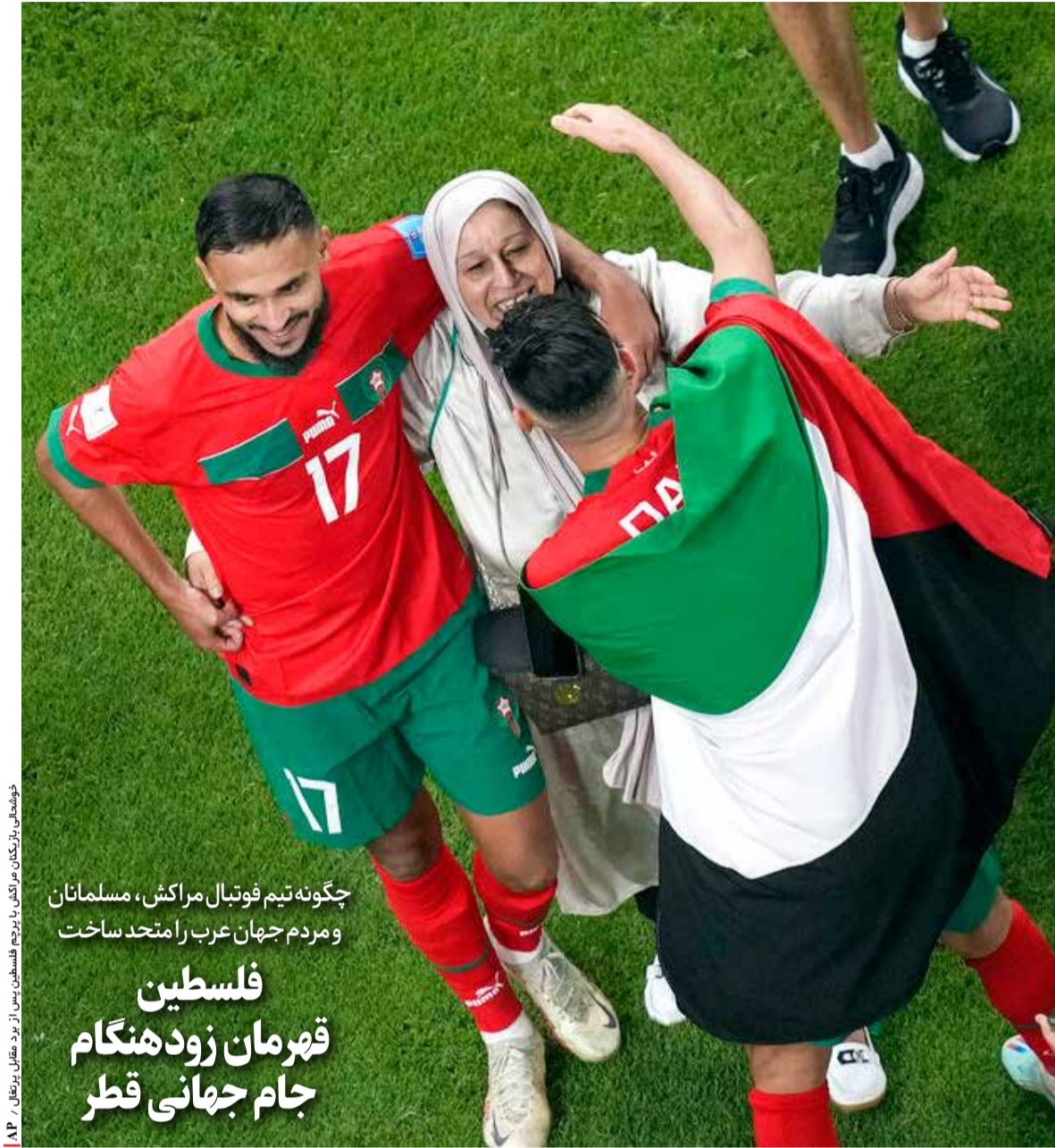
نوشته‌های بازیکنان مراکش با پرچم فلسطین پس از برد مقابل بریتانیا

چگونه تیم فوتبال مراکش، مسلمانان و مردم جهان عرب را متحد ساخت