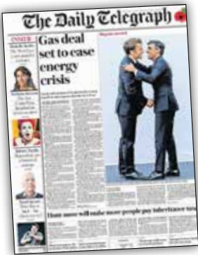
The Daily Telegraph

ریشی سوناک، نخست‌وزیر تازه منصوب شده انگلیس قرار است پس از نشست تغییرات اقلیمی، از بزرگترین قرارداد گازی کشورش با آمریکا رونمایی کند. به گفته کارشناسان این قرارداد در راستای حل بحران گاز و انرژی بسته شده و بر پایه انتقال گاز طبیعی مایع است. این محموله چند میلیارد مترمکعبی گاز مایع در صورت نهایی شدن مذاکرات، سال جاری به بریتانیا می‌رسد.