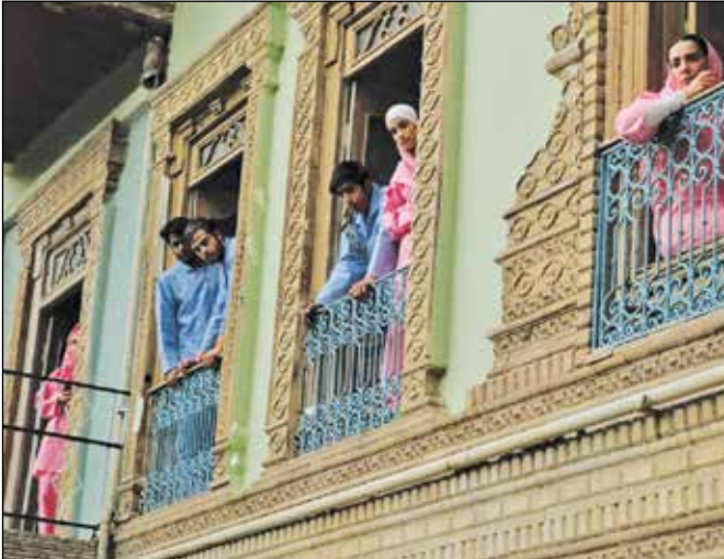
عمارتی در مه

را برعهده خواهد داشت.» هم‌اکنون فیلم‌های «هنر و تجربه» در ۲۰ سالن سینما در تهران و شهرستان از جمله پردیس‌های سینمایی هویزه، اطلس و ویلاژتوریست در شهر مشهد، مهدوی در شهر نیشابور، ساحل و سینتی سنتر در شهر اصفهان، بهمن در شهر سنج، عصر جدید در شهر گرگان، ستاره‌باران در شهر تبریز، مهر قدس در شهر همدان، گلستان در شهر شیراز، آزادی در شهر کرمانشاه، سینما سپهر در شهر ساری، تماشاخانه پارس کرمان در شهر کرمان و پردیس‌های سینمایی چارسو، ملت،