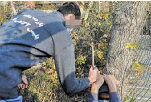
دیده چه خبر؟

■ مانند فعال کردن مجاری دیپلماسی غیررسمی و عمومی؟ ما باید سازگار روشنی برای فعال کردن دیپلماسی عمومی داشته باشیم. پیامد منفی پیگیری نه چندان رضایت‌بخش این وجه از دیپلماسی در تصویب قطعنامه اخراج جمهوری اسلامی از کمیسیون مقام زن سازمان ملل پدیدار شد. ما در این روند اصلاً دفاعی نداشتیم در حالی که بسیاری از کشورها مانند شیلی یا کلمبیا و بسیاری دیگر بودند که خیلی نسبت به وضعیت توجیه نبودند و این امکان وجود داشت که با آنها لابی کرد و رای آنها را متمتع کرد یا برگرداند. همچنین برخلاف تصور این‌که معتقد بود کشورهای آفریقایی با مواضع ایالات متحده همسو هستند، بسیاری از این کشورها به این قطعنامه رای متمتع دادند. این نشان می‌دهد که خیلی کوششگر نیستیم و راهبردی حرکت نمی‌کنیم. در مجموع، دیپلماسی عمومی کشور باید با په پای دیپلماسی رسمی و تحولاتی که در آژانس اتفاق می‌افتد، فعال شود در غیر این صورت کارکرد رسمی نهادهای سیاست خارجی را هم تحت تأثیر قرار می‌دهد.