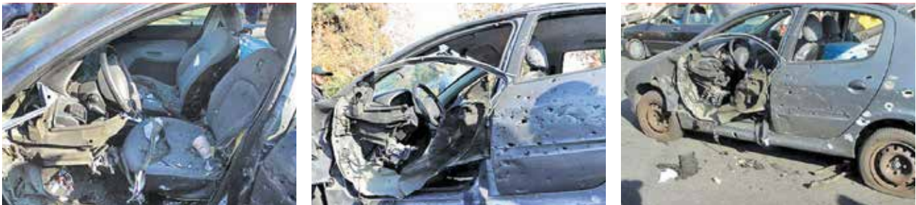
جان ساورز رئیس سازمان اطلاعات سری بریتانیا (ام آی ۶) تقریباً یک ماه قبل از ترور دانشمند شهید دکتر شهریار ی با اشاره به برنامه‌های علمی و فناوری ایران، دیپلماسی را برای توقف این برنامه ناگافی دانسته و به صراحت بر لزوم روی آوردن به فعالیت‌های جاسوسی و اطلاعاتی برای مقابله با ایران تأکید کرده بود.

کشور در تهدید نظامی کشور است. این موضوع بارها در خلال توافق هسته‌ای و با تکرار اتهام‌های همیشگی غرب در ارتباط با تلاش ایران برای دست‌یابی به تسلیحات اتمی دنبال شده است و آنها از این تهدید به عنوان گزینه روی میز نام برده‌اند. یکی از دخالت‌های فاحش انگلیس دخالت در مسائل هسته‌ای ایران است. این کشور به همراه دو کشور دیگر اروپایی یعنی آلمان و فرانسه همواره با فعالیت‌های هسته‌ای ایران مخالفت کرده‌اند و با دخالت‌های خود زمینه پیشرفت دانشمندان ایرانی را در این عرصه گرفته‌اند. علی‌رغم تأکید مکرر ایران بر مسالمت‌آمیز بودن برنامه‌های هسته‌ای‌اش، کشورهای اروپایی با اعمال فشار علیه ایران، خواستار لغو تمامی فعالیت‌های هسته‌ای ایران هستند. این کشورها می‌خواهند که ایران همواره نیازمند کمک آنان باشد و نتواند پیشرفت کند.