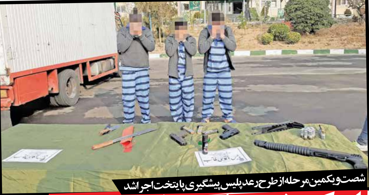
شصت و یکمین مرحله از طرح رعد پلیس پیشگیری پایتخت اجرا شد

بعد از آن متهم به جایگاه رفت و ضمن پذیرش اتهامش گفت: ناخواسته مرتکب قتل شدم. روز حادثه در حال خروج از قهوه‌خانه