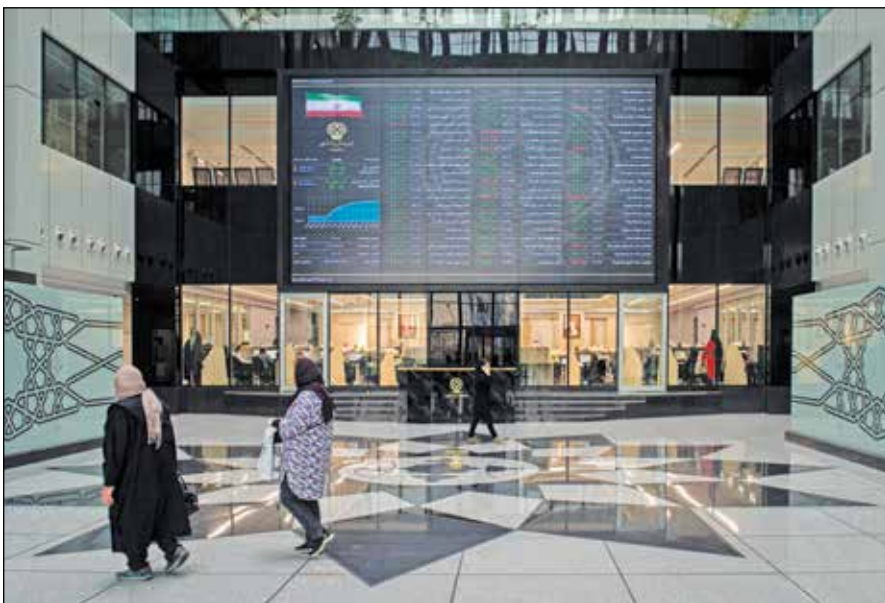
تصویری از بورس تهران

■ ارزش سهام عدالت افزایش یافت رشد قیمت سهام شرکت‌های عدالت نیز افزایش یابد به طوری که در پایان معاملات یکشنبه، ارزش سهام عدالت ۵۳۰ هزار تومانی، با افزایش بیش از ۷۰۰ هزار تومان نسبت به هفته گذشته، به حدود ۹ میلیون و ۳۴۴ هزار تومان رسید. ارزش سهام عدالت ۴۹ هزار تومانی نیز با همین نسبت افزایش یافت و به حدود ۸ میلیون و ۶۰۰ هزار تومان رسید.