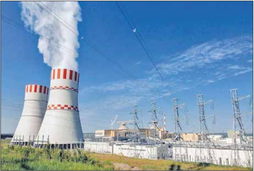
تولید برق در نیروگاه اتمی بوشهر

ناگفته نماند که اتحادیه اروپا، به دنبال جایگزینی گاز وارداتی از طریق