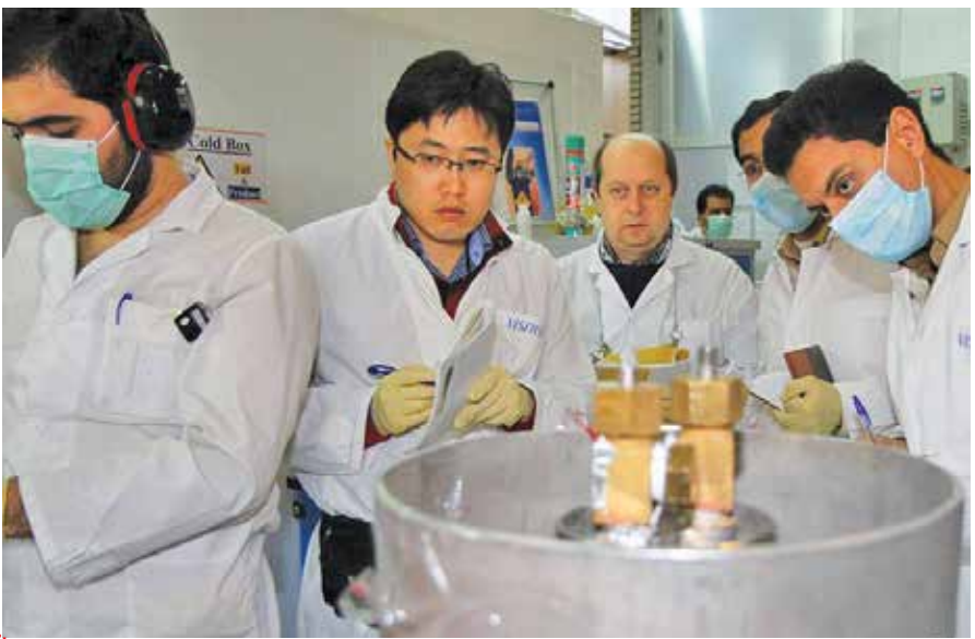
تصویری آرشیوی از حضور بازرسان آژانس در ایران

■ چطور می‌بینید؟ این تحلیل درست است. واقعیت این است که جمهوری اسلامی در سال‌های اخیر و پس از بدعهدی ایالات متحده و تصویب گسترده تحریم‌ها در صحنه سیاست خارجی کوششگر فعالی نبوده است و در پیگیری اقدامات فنی خود برای تلافی به عدم تحقق منافع اقتصادی‌اش در چهارچوب توافق ۲۰۱۵ متغلاعه عمل کرده است. فقط در ماه‌های اخیر مجموعه اقداماتی را در عرصه فعالیت‌های هسته‌ای با هدف تلافی صورت داده است. این در حالی است که کشورمان دارای امکانات متعددی در حوزه‌های گوناگون است تا صحنه این تقابل را خود تعیین کند. زمین بازی را عوض کند و به صورت کوششگرانه دست به اقدام بزند اما متأسفانه ما در حوزه‌های گوناگون دیپلماسی در سال‌های اخیر تاکنون کوششگر فعال نبوده و آنچه دیده‌ایم یکسری واکنش آن هم تنها در برخی از حوزه‌ها و نهادهای بوده است. این در حالی است که ما باید دست پیش داشته باشیم و ظرفیت‌های خود را برای اقدام فعالانه در دیگر حوزه‌ها افزایش دهیم.