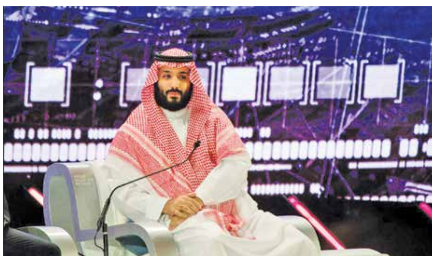
The New York Times

رژیم آل سعود گفت‌وگو می‌کردند. پس از قتل خاشقچی، تجزیه و تحلیل‌ها نشان داد که دستگاه‌های چند تن دیگر از نزدیکان خاشقچی از جمله همسر مصری و نامزد ترکیه‌ای او نیز هک شده بود. البته دولت عربستان سعودی از اظهارنظر در مورد این افشاگری‌ها خودداری کرد. گروه NSO در سال ۲۰۲۱ در گفت‌وگویی با روزنامه انگلیسی گاردین مدعی شده بود: «فناوری ما به هیچ وجه با قتل وحشتناک جمال خاشقچی مرتبط نبود». در واقع، هدف قرار دادن منتقدان رژیم آل سعود در خارج با بدافزارهای جاسوسی تنها یکی از راه‌های متعددی است که این رژیم با استفاده از فناوری دیجیتال برای سرکوب مخالفان استفاده کرده است.