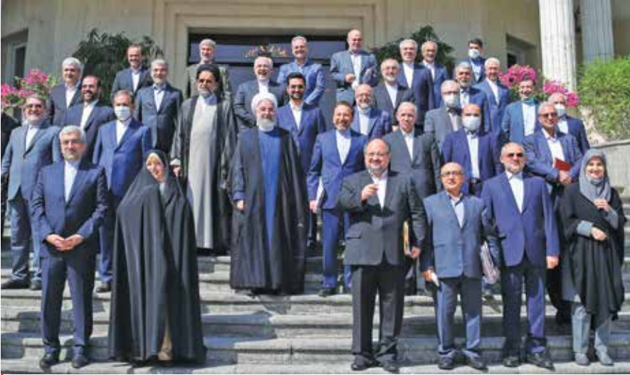
کابینه دولت دوازدهم

نویسنده این مقاله در ادامه با اشاره به ادعای دیگر مبنی بر درخواست روسیه برای دریافت دومین محموله پهپادی از ایران، اینگونه تحلیل کرد: در مقابل، مسکو ظاهرا سلاح‌های جدیدی شده از غرب و همچنین پول نقد را به تهران ارائه کرده است. نگارنده مقاله البته در توجیه