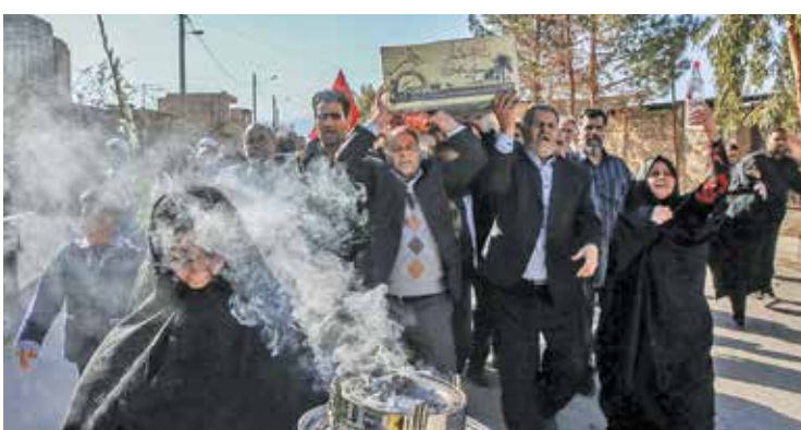
روستاها ی رفسنجان