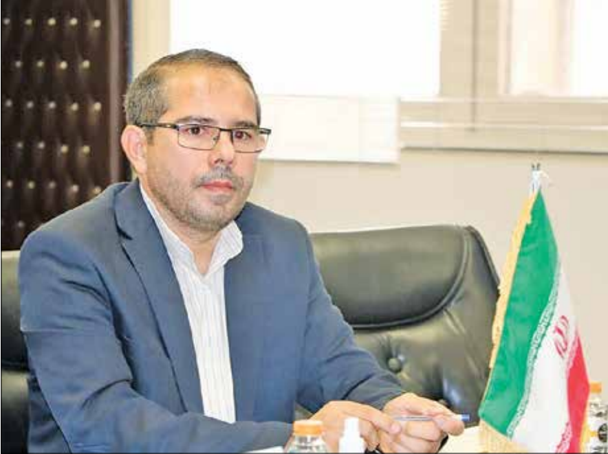
مدیرکل آسیای میانه، قفقاز و روسیه سازمان توسعه تجارت در گفت‌وگو با «ایران» برنامه‌های دولت سیزدهم برای صادرات کالاهای ایرانی به کشورهای حاشیه دریای خزر را تشریح کرد

از ابتدای فعالیت دولت سیزدهم گفت‌وگوهای متعددی برای پیوستن ایران به موافقتنامه‌های بین‌المللی صورت گرفته است و همچنین برای انعقاد موافقتنامه تجارت آزاد با کشورهای عضو اوراسیا نشست‌های تخصصی برگزار شده است