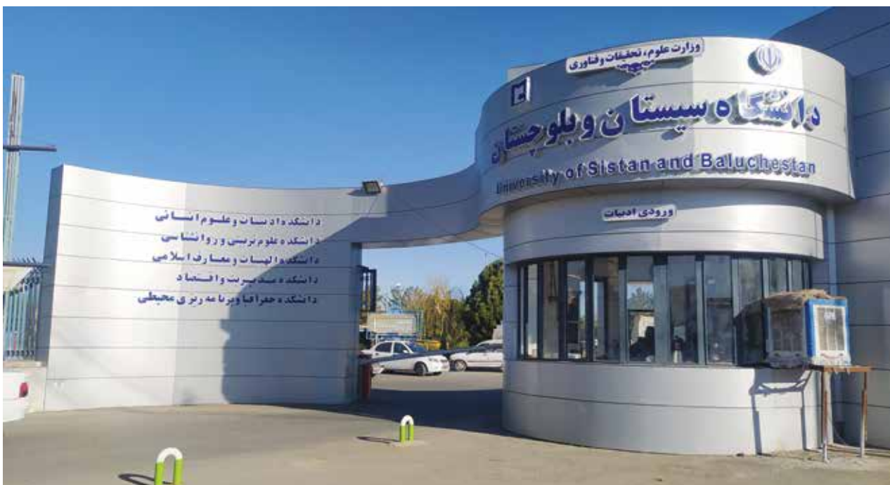
سایت دانشگاه سیستان و بلوچستان

تبعات مخرب سیاست بومی‌گزینی و محلی‌گرایی در دانشگاه‌های مناطق مرزی