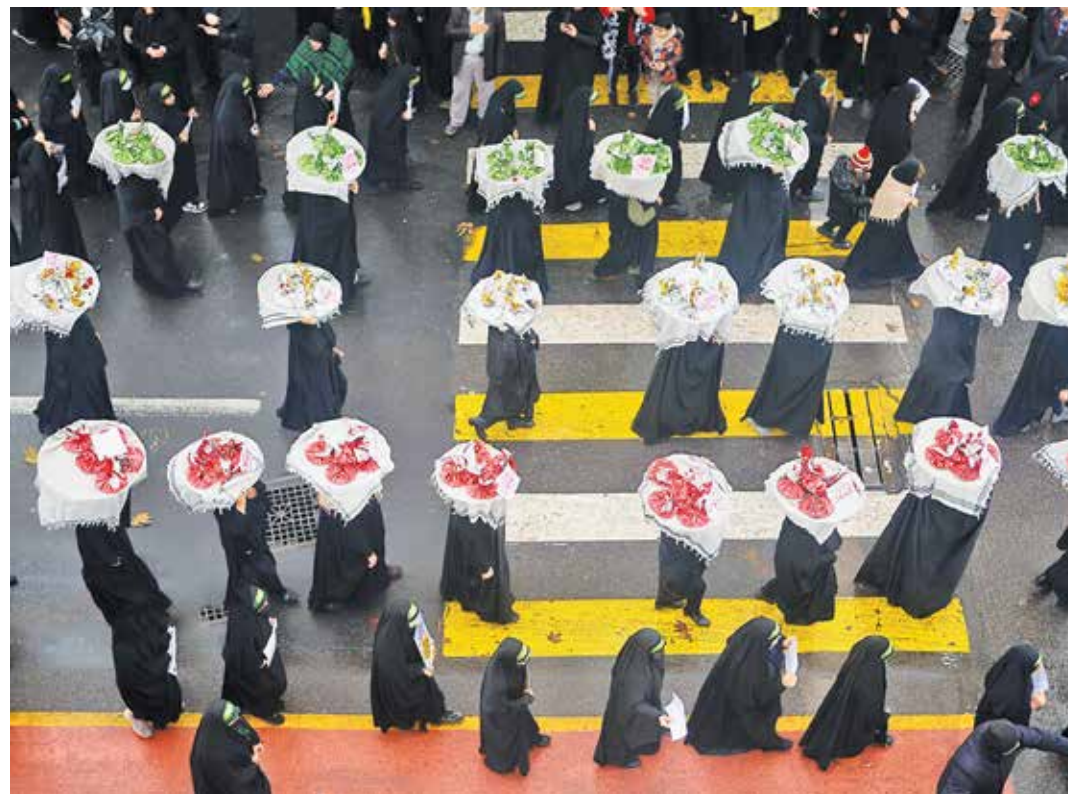
ساری / ایرنا