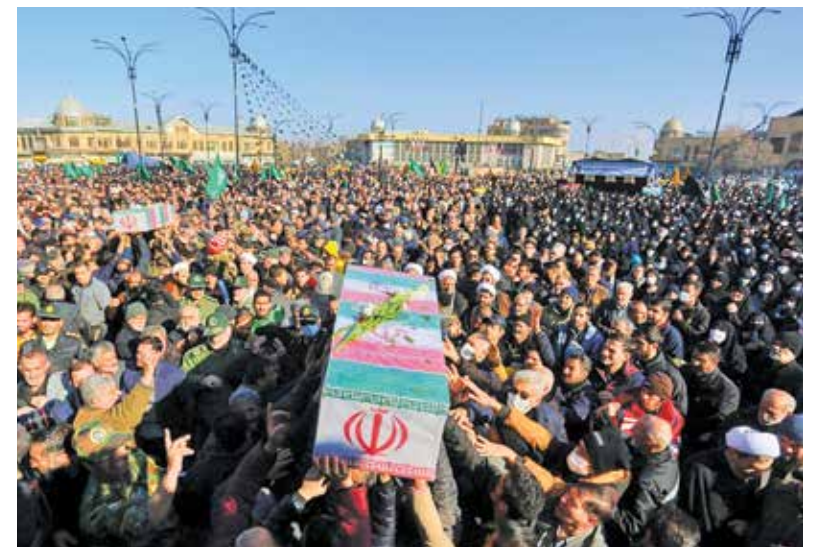
همدان / باشگاه خبرنگاران جوان