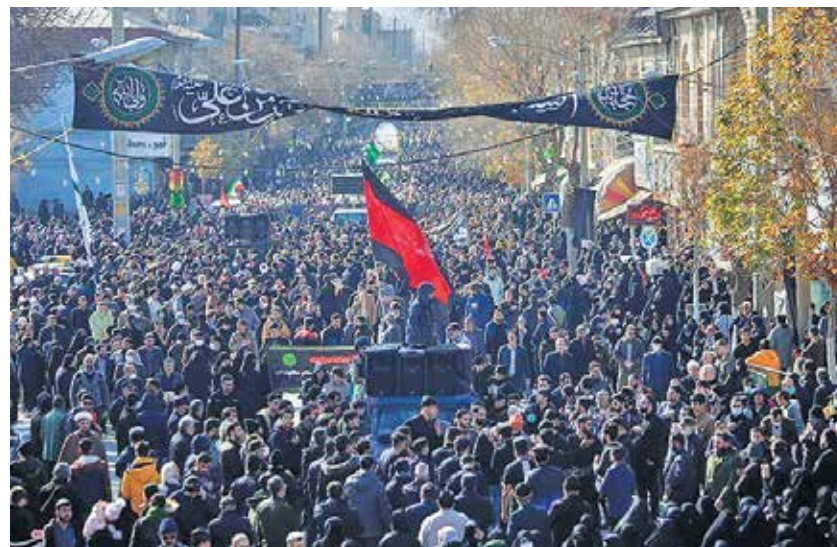
کرمانشاه / تسنیم