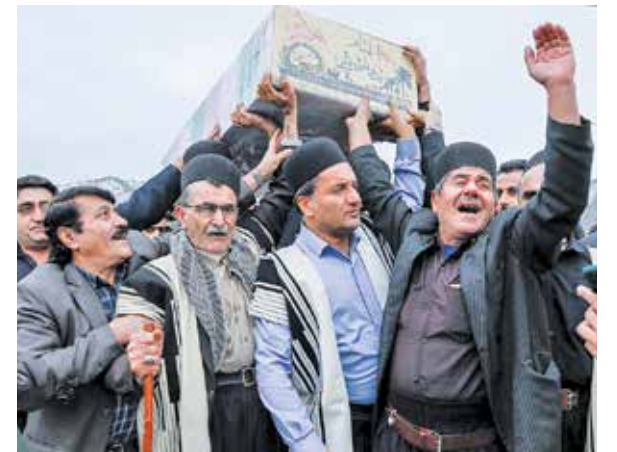
عشایر بختیاری