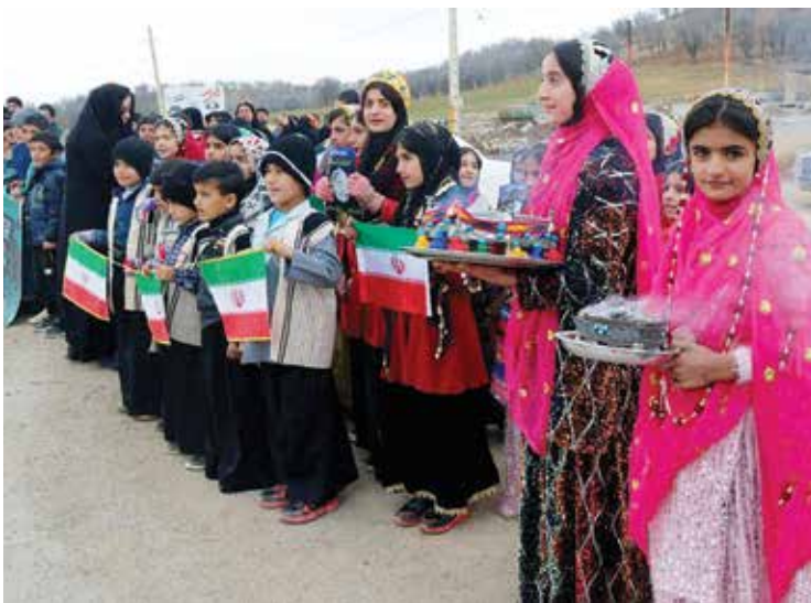
شهرستان بافت در استان چهارمحال بختیاری