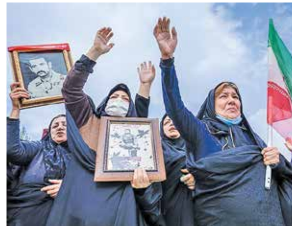
خرم‌آباد / تسنیم