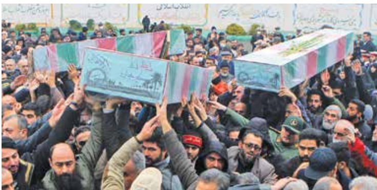
رشت / ایرنا