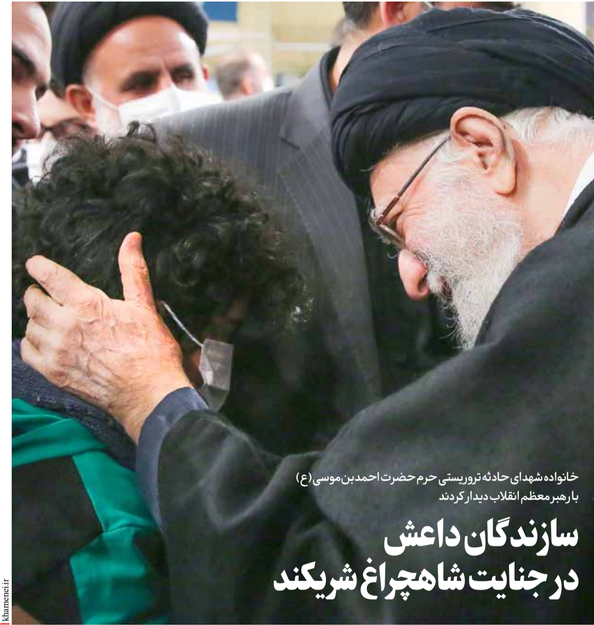
خانواده شهیدای حادثه تروریستی حرم حضرت احمد بن موسی (ع) بارهبر معظم انقلاب دیدار کردند