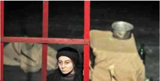
عکس تئاترینما است