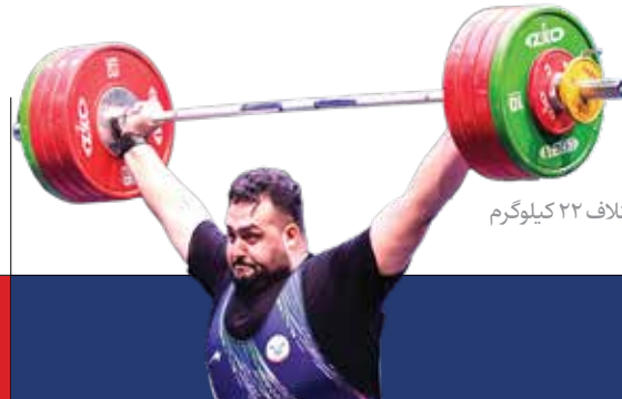
سه‌طلای هرکول ایرانی در کوبا داوودی در حرکت یک‌ضرب خود موفق به مهار وزنه ۲۰۳ کیلوگرم شد و با اختلاف ۲۲ کیلوگرم نسبت به نفر دوم به مدال طلای یک‌ضرب رسید