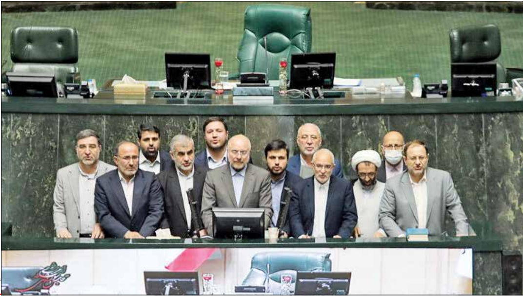
نمایندگان مجلس یازدهم در جریان نشست خبری در روز چهارشنبه ۱ دی ۱۴۰۱

■ پنجشنبه ۱ دی ۱۴۰۱ ■ سال بیست و هشتم ■ شماره ۸۰۸۵