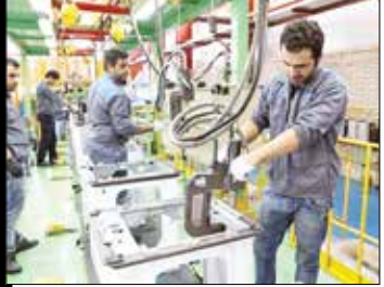
معاون صنایع عمومی وزارت صمت با بیان اینکه در کشورمان صادرات مواد خام داریم، اما اولویت‌بندی که باید به صنایع پایین دستی مانند لوازم خانگی اختصاص یابد هنوز صورت نگرفته است، گفت: هفته گذشته تفاهنامه‌ای با شرکت صنایع پتروشیمی داشته‌ایم که بر اساس آن مواد پتروشیمی باید به لوازم خانگی اختصاص یابد تا باعث افزایش تولید شود.

معاون صنایع عمومی وزارت صمت با بیان اینکه در کشورمان صادرات مواد خام داریم، اما اولویت‌بندی که باید به صنایع پایین دستی مانند لوازم خانگی اختصاص یابد هنوز صورت نگرفته است، گفت: هفته گذشته تفاهنامه‌ای با شرکت صنایع پتروشیمی داشته‌ایم که بر اساس آن مواد پتروشیمی باید به لوازم خانگی اختصاص یابد تا باعث افزایش تولید شود. او اضافه کرد: به منظور افزایش تولید لوازم خانگی، به تولیدکنندگان این اجازه داده شد مواد اولیه‌ای را که در داخل تأمین نمی‌شود یا تعرفه گمرکی پایین و نزدیک به یک وارد کنند تا مطمئن شویم در ۶ ماه آینده در تأمین مواد اولیه با تخفیف ارزی مناسب، مشکلی به وجود نخواهد آمد ضمن اینکه برای تولیدکنندگانی که تاکنون با ارز نیمی از محصولات را خریداری کرده اند مشکلی در تأمین وجود نخواهد داشت. برداران ادامه داد: برای گام‌های بزرگ‌تر، از نظام بانکی برای افزایش تولید کمک گرفته شده است و حداقل کاری که باید صورت گیرد این است که تسهیلات بانکی سال گذشته نیز برای تولیدکنندگان تمدید شود. در این باره نشست کارگروه‌های تخصصی از سوی وزارت صمت با مجموعه نظام بانکی برنامه‌ریزی شده و سعی می‌کنیم مشکلات تولیدکنندگان را به حداقل برسانیم.