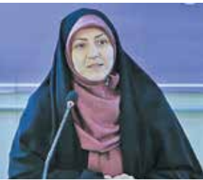
نسبت به دوره قبل ۷۴ درصد رشد داشته است. در بخش مستندنگاری ۶۹۰ اثر به دبیرخانه جایزه رسید که نسبت به دوره گذشته با ۳۶۱ اثر رسیده، رشد ۹۱/۰۷ درصدی را نشان می‌دهد. در بخش نقد ادبی ۷۷ اثر به دبیرخانه جایزه رسیده که آثار دریافتی در این بخش نسبت به سال قبل با ۲۸ اثر رسیده، از رشد ۷۷۵ درصدی برخوردار است. در بخش داستان کوتاه ۴۰۱ اثر دریافت شده که نسبت به سال قبل با ۲۳۷ اثر، رشد ۶۹/۰۷ درصدی داشته است. در بخش رمان و داستان بلند نیز ۱۵۰۸ اثر به دبیرخانه جایزه رسیده که نسبت به سال قبل با ۹۱۰ اثر، رشد ۶۶/۰۷ درصدی تجربه کرده است.

استادان پیشکسوت آثار خوبی به دبیرخانه رسیده و تنوع و تکثر ناشران و نویسندگان در این دوره دیده می‌شود. آثار ارسالی بعضاً با از طریق ناشران به دبیرخانه ارسال شده یا خود نویسنده اقدام به ارسال کرده است. ■ استقبال اهالی نشر و کتاب برای شرکت در پانزدهمین دوره این جایزه به چه شکل بوده؟ دبیرخانه این دوره جایزه جلال از اول خردادماه ۱۴۰۱ آغاز به کار کرد و فراخوان جایزه اول شهریورماه منتشر شد که تا پایان مهرماه ادامه داشت. همان‌طور که اشاره شد میزان آثار رسیده به دبیرخانه