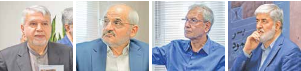
سیدرضا صالحی امیری