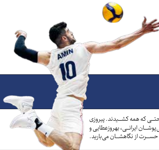
اولین برد ایران در لیگ ملت ها رقم خورد