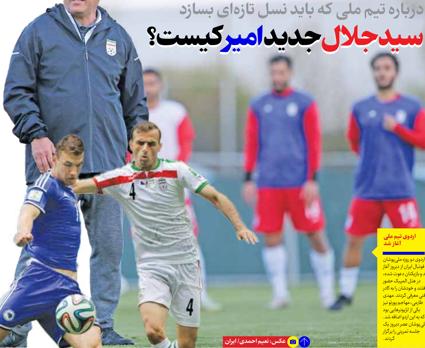
اردوی تیم ملی آغاز شد