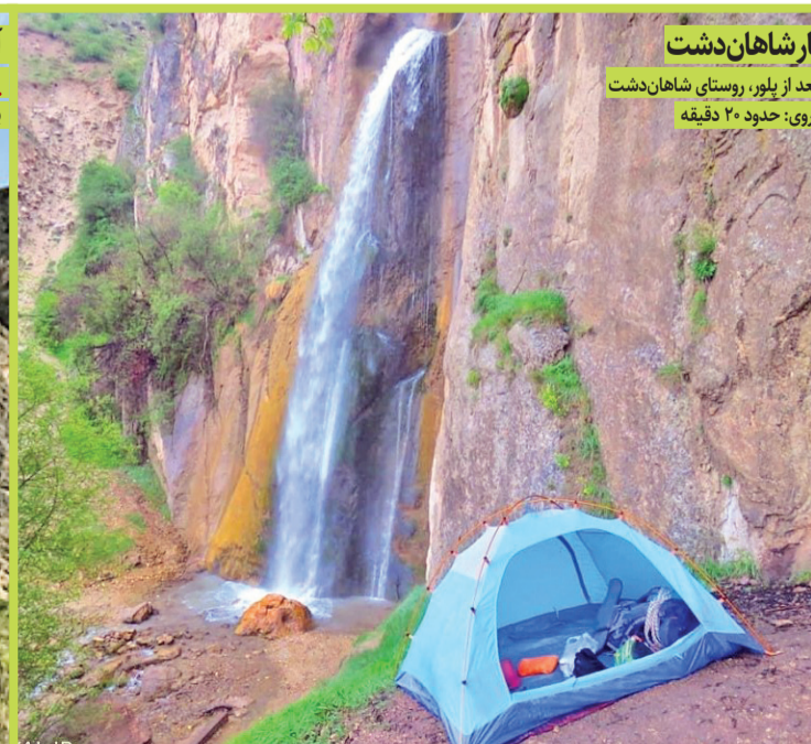
آبشار شاهان دشت بعد از یلور، روستای شاهان دشت بیاده روی: حدود ۲۰ دقیقه