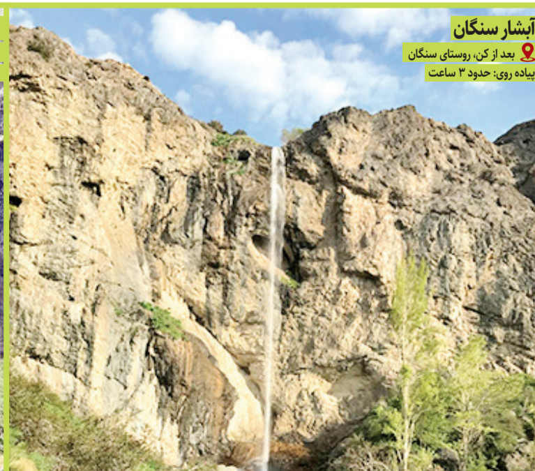
آبشار سنگان بعد از کن، روستای سنگان بیاده روی: حدود ۳ ساعت