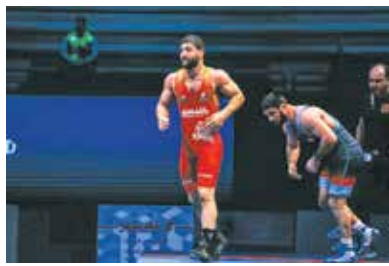
گربه سیاه باروز به اردو نمی رود