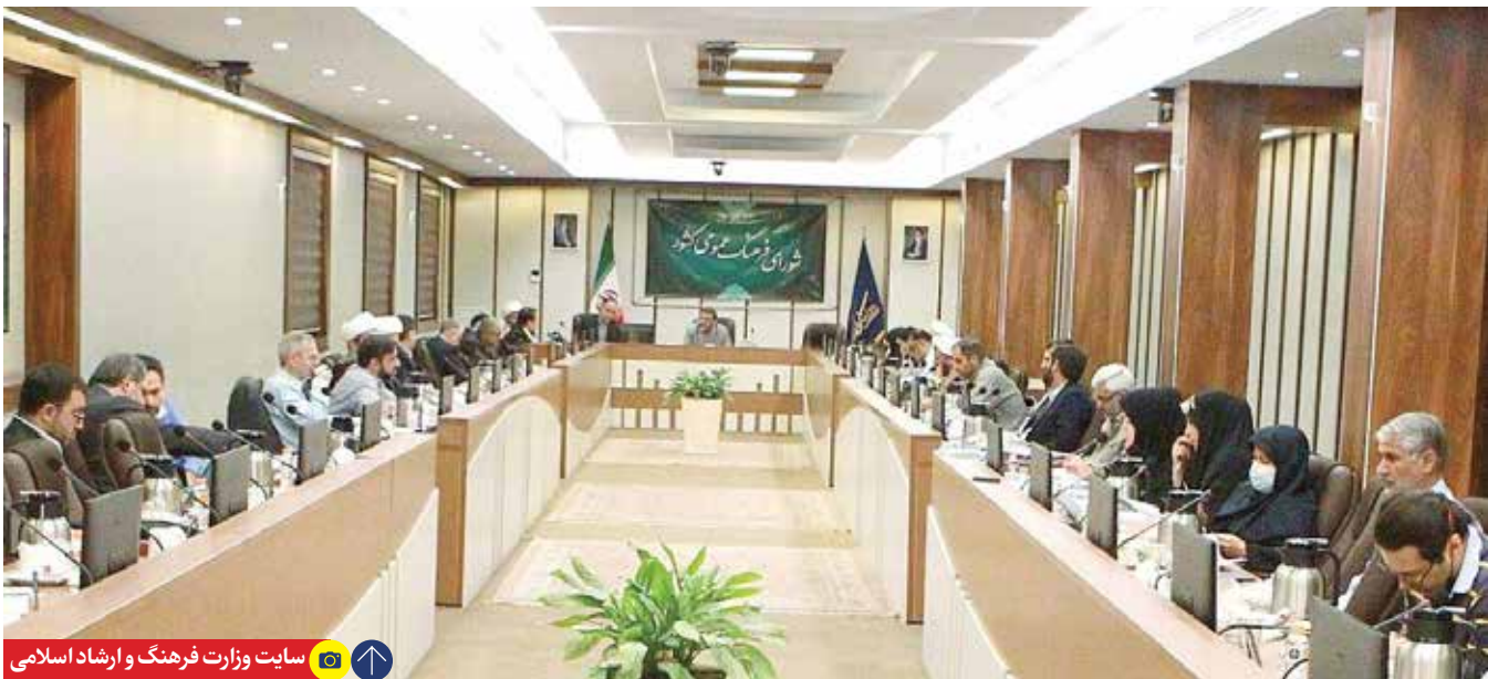
سایت وزارت فرهنگ و ارشاد اسلامی

تنظیم‌گری حوزه بازی‌های رایانه‌ای می‌تواند در شکل‌گیری بنیاد سبک پوشش ایرانی اسلامی مورد توجه قرار گیرد، اما با وجود این باید بازخورد نهادهای مختلف قانونگذار و اجرایی در تأسیس بنیاد مورد توجه قرار گیرد تا شاهد تأثیرگذاری هر چه بیشتر آن در فضای جامعه باشیم.» وزیر فرهنگ و ارشاد اسلامی در جلسه شورای فرهنگ عمومی درباره شکل‌گیری بنیاد سبک پوشش ایرانی اسلامی گفت: «کارگروه ساماندهی مد و لباس، پیش‌تر زیرمجموعه معاونت هنری وزارت فرهنگ و ارشاد اسلامی بود اما در آغاز فعالیت دولت مردمی، در راستای هماهنگی بیشتر با سیاست‌گذاری شورای فرهنگ عمومی، زیرمجموعه این شورا قرار گرفت.» اسماعیلی در پایان سخنانش تأکید کرد: «تجربه موفق بنیاد بازی‌های رایانه‌ای در حمایت و