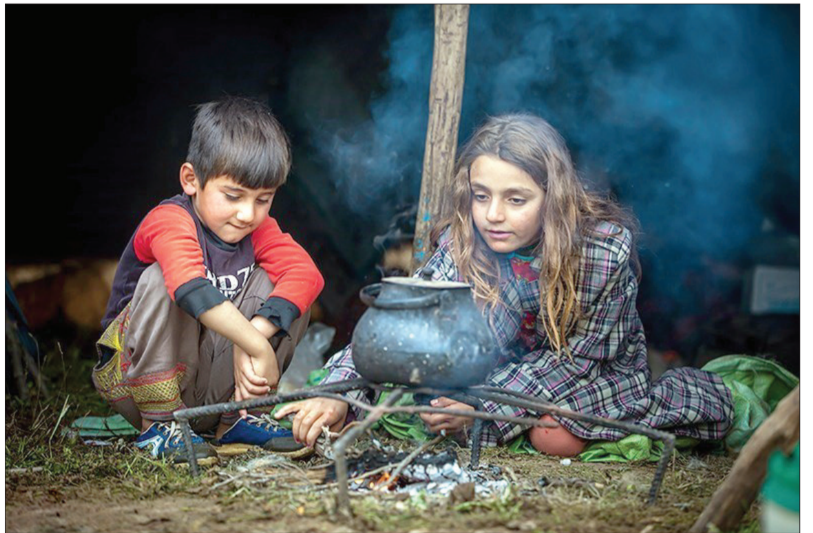
▲ کودکان کوچ عشایر، لرستان