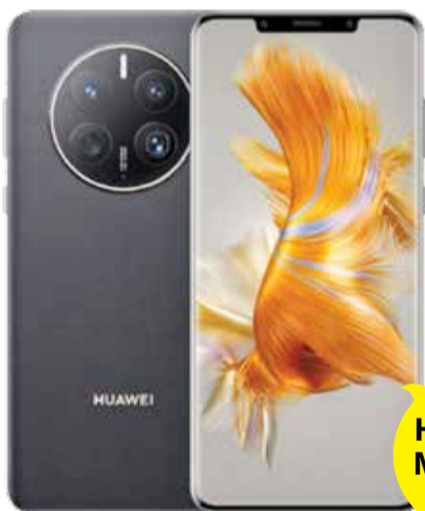
Huawei Mate 50 Pro