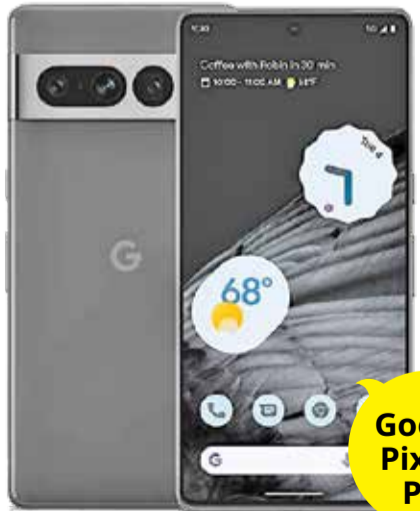
Google Pixel 7 Pro