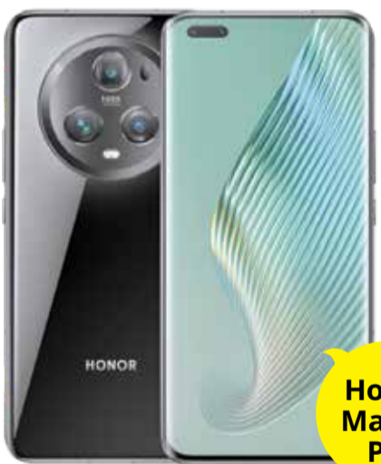
Honor Magic5 Pro