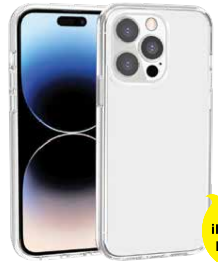
Apple iPhone 14 Pro Max