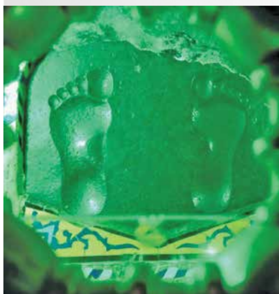
انرژی منسوب به امام رضا(ع) در قدمگاه

سفر امام، سفری اجباری و پر از اندوه و فراق بود. اما، امروزه شاید هیچ‌کدام ما نتوانیم تصور کنیم ایران بدون امام رضا(ع) و مشهد و حرم قدسی او چه می‌شد. به واسطه حضور امام، ایرانی‌های محب اهل بیت(ع) فرصت داشتند از حضور او و البته خواهران و برادران ایشان در شهرهای مختلف بهره ببرند. برای بسیاری از ایرانی‌ها امام نه میهمان، که میزبان و ولی‌نعمت این کشور و ستون و تکیه‌گاه مردم است. شاید کمتر کسی باشد که با یادآوری مشهدالرضا این مصرع را با خود زمزمه نکند: آمدم ای شاه، پنجم بده!