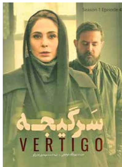
گزارش «ایران» از گونه‌های مورد توجه پلتفرم‌های نمایش خانگی