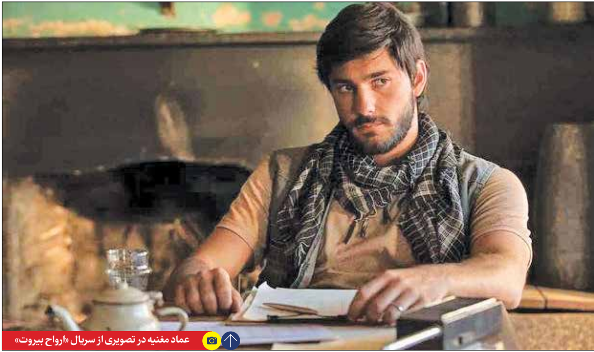
عماد مغنیه در تصویری از سریال «ارواح بیروت»