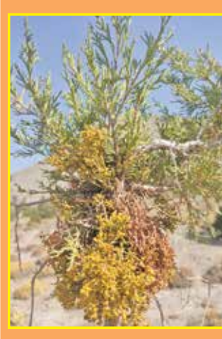
«دارواش» مختص درختان ارس به نام ارس‌واش یا نام علمی Arceuthobium oxycedri است که خاص مخروطیان بوده و حیات آنها را تهدید جدی روبرو می‌کند. این گیاه نیمه‌انگل قاعد ریشه بوده ولی به علت داشتن سبزینه و کروئیل نیمه‌انگلی محسوب شده است که پس از شدن روی گیاه میزبان از شیره خام میزبان استفاده می‌کند و مواد غذایی‌اش را از میزبان می‌گیرد.

رئیس اداره حفاظت و حمایت اداره کل منابع طبیعی و آبخیزداری استان سمنان، به رخداد تنش‌های اجتماعی گسترده ناشی از قطع درختان آلوده اشاره کرده و می‌گوید: مردم اغلب اعتراض کرده و در تلاشند تا از قطع درختان آلوده جلوگیری کنند؛ این در حالی است که آنها باید بپذیرند که در صورت علاقه‌مندی به این درختان ارزشمند، باید حفاظت را جدی‌تر گرفته و از انتشار آلودگی به دیگر درختان جلوگیری کنند؛ بر این اساس، چنانچه درختی کاملاً آلوده و خشک شود باید هرچه سریع‌تر قطع شود. در حقیقت این مبارزه انجام می‌شود تا از انتشار آلودگی به دیگر درختان جلوگیری شده و حیات ارس‌ها به مخاطره نیفتد.