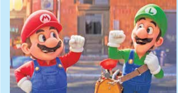
مشخصات فیلم: «برادران سوپر ماریو» کارگردان‌ها: آرون هوروات و مایکل بلنیک سناریست: متیو فوگل صدایبیشه‌ها: کریس برات، آنیا تیلور جوی، جک بلک، ست روگن، کیگان مایکل کی، چارلی دی و فرد آریمیس هزینه تولید: ۱۰۰ میلیون دلار میزان فروش: بیش از ۲/۱ میلیارد دلار

همه این توفیق‌ها سبب شده است نگاه مردم و منتقدان به این فیلم بسیار فراتر از یک کارتون صرف باشد و شیرینی‌ها و در عین حال دشواری‌های زندگی برادران ماریو که در بروکلین آمریکا یک مغازه تعمیراتی را به راه انداخته و تخصص شان لوله‌سازی و تلمبه زدن است، بینندگان را به وجد باورد. کسب‌وکار موفق آنها موجب حسادت اسپیک شده که کارفرمای سابق آنها است و حتی پدرشان هم دل خوشی از کار و حرفه آنها ندارد. وقتی آنها برای تعمیر یک شاه‌لوله سوراخ شده آب در سطح شهر بروکلین به اعمال زمین نقب می‌زنند، گرفتار بلای بزرگی می‌شوند و همان‌طور که پیش‌تر آمد، به یک دنیای موازی پرخطر انتقال می‌یابند اما اتفاقاتی که در آنجا برایشان روی می‌دهد، با وجود همه قهوه‌ر و غیرقابل باور بودنش، برای جذب تماشاگران آثار فیلم کفایت می‌کند.