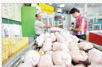
عکس ترابری است

وزارت جهاد کشاورزی یک سامانه پیامکی برای معرفی واحدهایی راه‌اندازی کرده است که اقدام به فروش مرغ با قیمت بالاتر از نرخ مصوب می‌کنند. به گزارش مهر، هموطنان می‌توانند از طریق این سامانه، احتکار یا فروش مرغ بالاتر از هر کیلوگرم ۷۳ هزار تومان را به سامانه پیامکی ۳۰۰۰۱۱۳۶ اعلام کنند تا به آن رسیدگی شود. در این پیامک اسم استان، شهر و آدرس محل اعلام می‌شود تا بازرسان بتوانند به آن رسیدگی کنند. شهروندان همچنین می‌توانند عکس و فیلم تخلفات انجام شده در این زمینه را به آدرس https://eitaa.com/keshavarziran ارسال کنند.