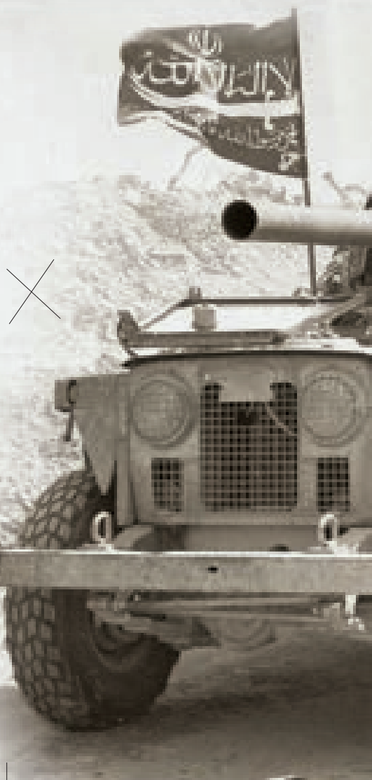
Ⓜ عملیات بیت‌المقدس، اردیبهشت ۱۳۶۱. گزارش نویسان سازمان سیا شکست سخت دیگری را برای صدام پیش‌بینی می‌کنند.

تهران در خلیج فارس [فارس] ترکیبی پیچیده از دیپلماسی و تهدیدهای در لفافه را برای واداشتن کشورهای عربی خلیج فارس [فارس] به بازنگری در حمایت‌شان از رژیم عراق که شکستش از هم‌اکنون مسلم است، به کار می‌گیرد. در حال حاضر، تهران از تلافی‌جویی در قبال گمانه‌زنی‌های حاکی از همکاری نظامی این کشور با بغداد در جریان