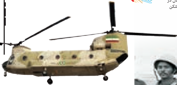
⊕ برای هلی‌برن نیرو از این نوع بالگردها استفاده می‌شد. یکی از تکرانی‌های ارتش صدام این بود که ایران برای آزادی خرمشهر از هلی‌برن استفاده کند.