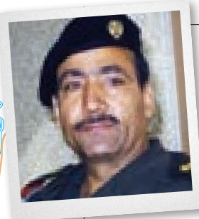
⊖ ماهر عبدالرشید از فرماندهان اصلی جبهه‌ی عراق که در کنار عدنان خیرالله عالی‌ترین مقامات نظامی ارتش عراق در جنگ بودند.

از کارون و رسیدن به جاده‌ی اهواز-خرمشهر بود. عبور از رودخانه در عملیات نظامی فرایندی بسیار پیچیده بود که شاید از نظر عراقی‌ها ایرانی‌ها