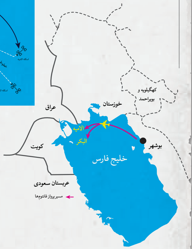
⊙ آذر ۱۳۵۹ حمله‌ی نیروی دریایی ارتش ایران به اسکله‌های نفتی البکر و الامیه‌ی عراق در دهانه‌ی خلیج فارس. مقیاس حمله به تأسیسات نفتی طرفین در آغاز جنگ وسیع نبود.

در سطوح پایین است. در چنین وضعیتی، عربستان سعودی احتمالاً به عراق فشار می‌آورد تا صادرات نفتش را کم‌تر از سهمیه‌اش در اوپک نگه دارد. ممکن است عراق، در ازای استمرار استقراض از اعضای اوپک، حاضر باشد تولیدش را آهسته‌تر از آنچه توانش اجازه می‌دهد، افزایش دهد.» در بندهای بعدی تأثیر جنگ بر بازار نفت با جزئیات تشریح شده است و همچنین توضیح داده شده که پیشروی نظامی ایران به سوی جنوب عراق هیچ تأثیر فوری بر صادرات کنونی نفت خام عراق نخواهد گذاشت؛ «همه‌ی تولید و فرآوری نفت خام عراق در حال حاضر در شمال انجام می‌شود و صادرات فقط از خط لوله‌ی عراق-ترکیه صورت می‌گیرد. با این حال، اقدام نظامی در جنوب می‌تواند میدان‌های نفتی حاوی نیمی از ظرفیت تولیدی نفت عراق را به خطر بیندازد و بزرگ‌ترین پالایشگاه این کشور را تهدید کند: