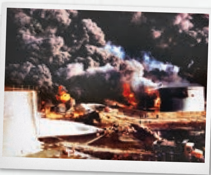
⊙ بمباران پالایشگاه آبادان، دوم مهر ۱۳۵۹. گزارش سیا می‌گفت جنگ تأثیر مخربی بر بازار نفت نداشته است.

از سهمیه‌ی ۱/۲ میلیون بشکه در روزی است که اوپک برای بغداد تعیین کرده است. اما نوشته‌اند که عراق ترجیح می‌دهد راه جایگزین را فعال کند و صادرات نفت از خلیج فارس را در پیش بگیرد؛ «عراق احتمالاً