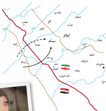
① مسیر تهاجم بعثی‌ها به منطقه‌ی میمک در ۱۹ شهریور. آن‌ها می‌گفتند بر اساس قرارداد الجزایر این مناطق باید به آن‌ها واگذار می‌شده است.