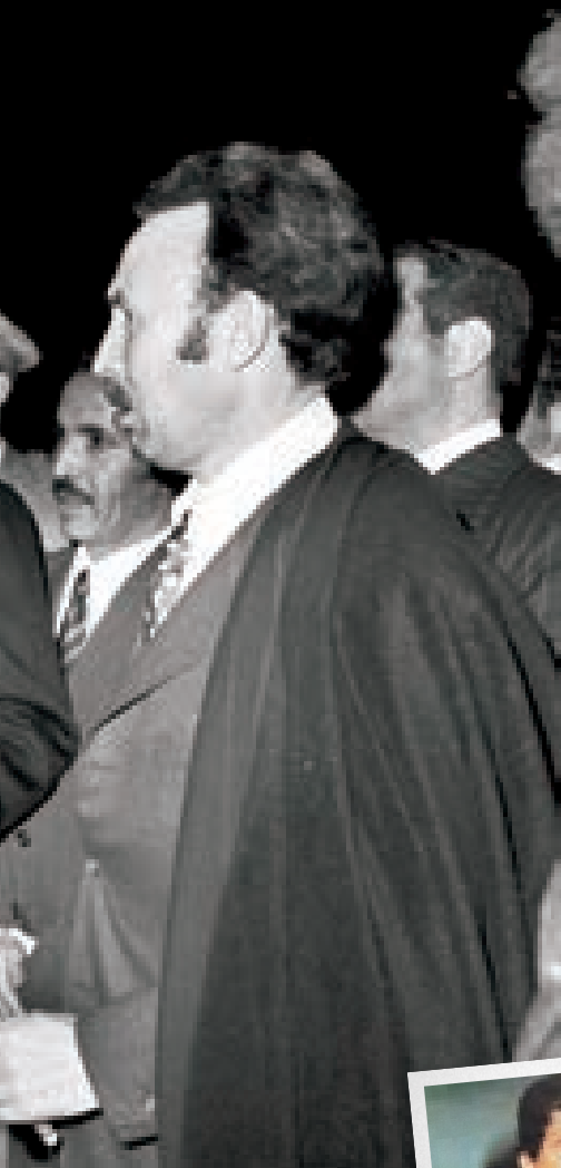
➔ عدنان خیرالله در رأس ارتش عراق بود. در میان انتصاب‌های سیاسی صدام در ارتش، او از نظر نظامی کارآمدتر از سایر فرماندهان منصوب شده بود.

این بخش مرور متن پیاده‌شده‌ی نوار جلسہ‌ی صدام و تعدادی از مقامات حزب بعث در تاریخ ۲۵ شهریور ۱۳۵۹ است. نوارهای جلسات پس از سقوط صدام، توسط آمریکایی‌ها به ایالات متحده برده شده است. این جلسه یک روز پیش از آن است که صدام قرارداد الجزایر را ملغی اعلام کند. یک هفته پس از این جلسه نیز هجوم سراسری ارتش عراق به ایران آغاز شد. کوین وودز و همکارانش در کتاب نوارهای صدام بخش‌هایی از این جلسه‌ی مهم و تاریخی را آورده‌اند. محتوای این جلسه به‌صورت اختصاصی توسط تیم تحقیقاتی خارج از مرز ترجمه شده است.