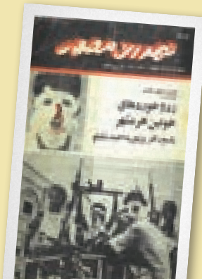
۲۳ اردیبهشت ۵۸

از دهه‌ی سوم خرداد راهپیمایی‌ها و اعتراضات با دخالت نیروهای نظامی و انتظامی کم‌رنگ شد و در مقابل بمب‌گذاری در خرمشهر با حمایت عراق شدت گرفت؛ جنگی که تا شهریور ۵۹ و در آستانه‌ی آغاز هجوم سراسری عراق ادامه داشت. ده‌ها مورد بمب‌گذاری در شهر؛ ۱۲۶ مجروح و ۱۹ شهید به جا گذاشت.