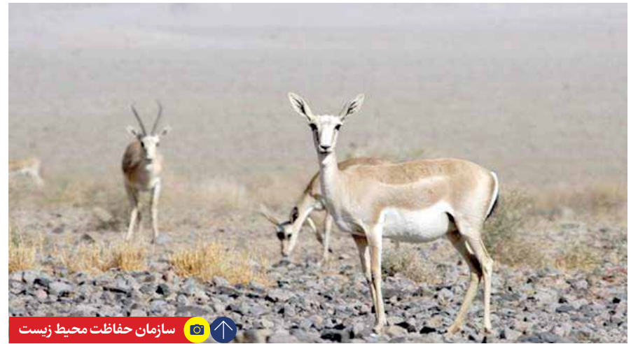
سازمان حفاظت محیط زیست