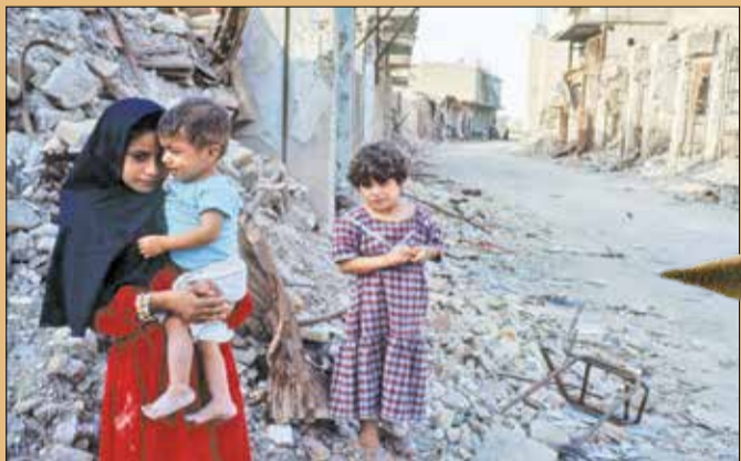
کودکان در خرابه های خرمشهر