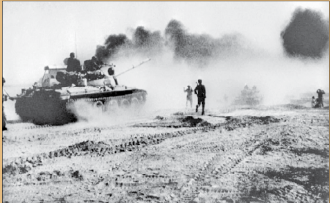
تصویری از لحظات حمله به خرمشهر ۳۰ مهر ۱۳۵۹

آزادی شهر خرمشهر پس از ۱۹ ماه بی شک نقطه عطفی در تاریخ جنگ و همچنین در تاریخ مقاومت مردم ایران در برابر اشغالگران محسوب می شود؛ زیرا این موفقیت بزرگ تنها آزادی یک بندر راهبردی در جنوب ایران نبود، بلکه آزادی خرمشهر به نمادی برای همبستگی مردم ایران در برابر متجاوزان یعنی صدامی تبدیل شد. به همین دلیل این روز بزرگ برای همیشه در حافظه تاریخ مردم ایران می ماند. خرمشهری که پس از ۵۷۵ روز اشغال و ۳۵ روز مقاومت، چهارم آبان ۱۳۵۹ توسط رژیم تا دندان مسلح بعثی عراق اشغال و در ساعت ۱۱ صبح روز سوم خرداد ۱۳۶۱ در عملیات بیت المقدس آزاد شد؛ این خبر با وجود گذشت سال ها برای کسانی که هرگز خرمشهر را به چشم ندیدند شیرین ترین خبر بوده و هست.