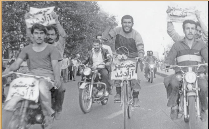
رژه موتورسواران در خیابان ها به مناسبت آزادی خرمشهر