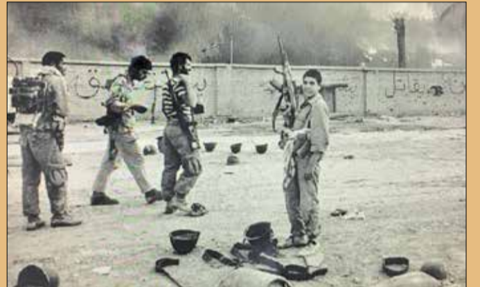
خوشحالی نوجوانی در وسط معرکه جنگ