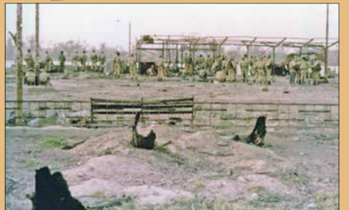
نمایی از ویرانه های به جا مانده از تجاوز نیروهای عراقی به خرمشهر پس از فتح آن شهر به دست رزمندگان اسلام