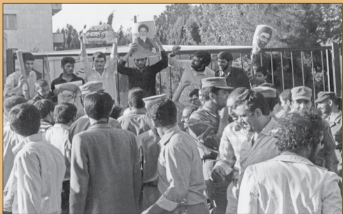
شادی مردم از آزاد شدن شهر خرمشهر