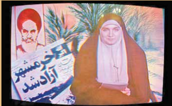
انعکاس آزادی خرمشهر در صدا و سیما