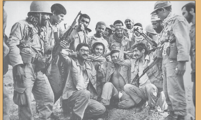
اسرای عراقی در منطقه عملیاتی بیت المقدس، عکس: کاظم اخوان