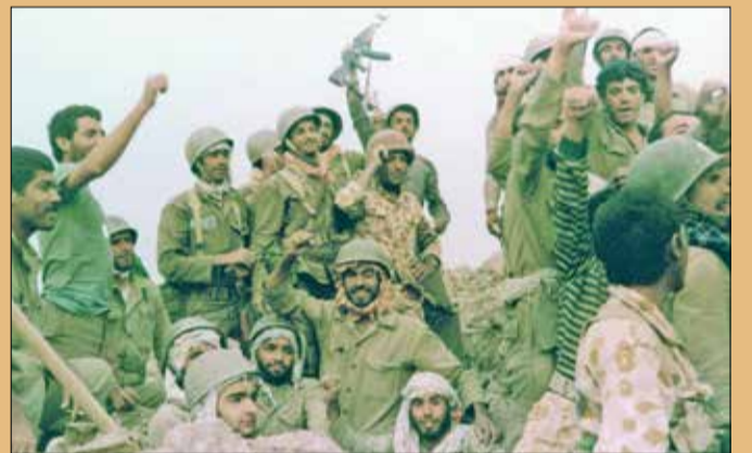
شادی رزمندگان پس از آزادی خرمشهر