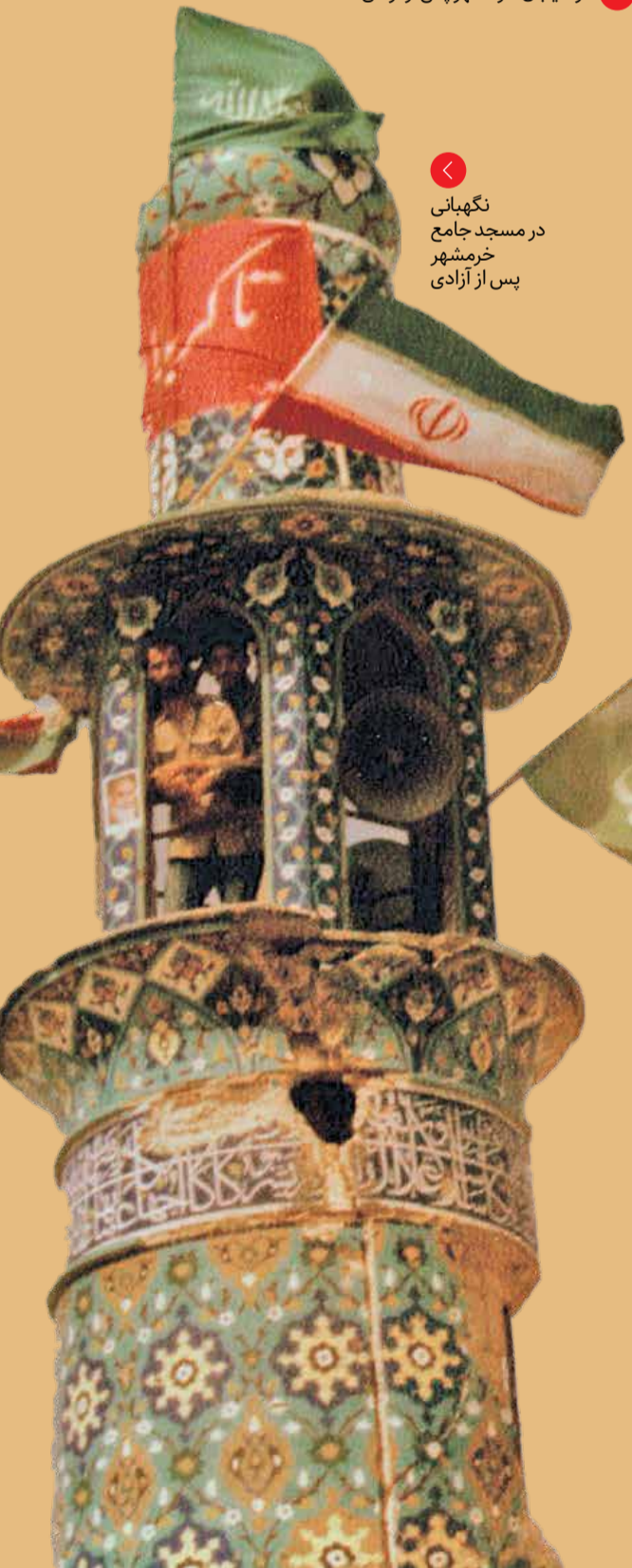
نگهبانی در مسجد جامع خرمشهر پس از آزادی