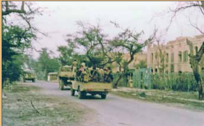
در خیابان خرمشهر پس از آزادی