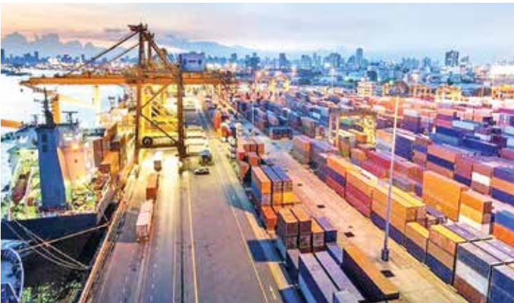
تجارت غیرنفتی ایران با 15 کشور همسایه (میلیون دلار)

تراز تجاری در فروردین امسال با ۱۵ کشور منطقه ۴۶۲ میلیون دلار به نفع ایران بود