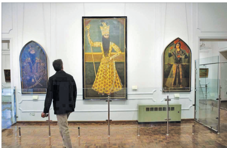
عکس تزئینی است

در بخش اول برنامه قطعاتی از جمله پند حکیم، فریدون و ضحاک، سیاوش و سودابه و شهر آزادگان و در بخش دوم داستان رستم و اسفندیار اجرا خواهد شد.