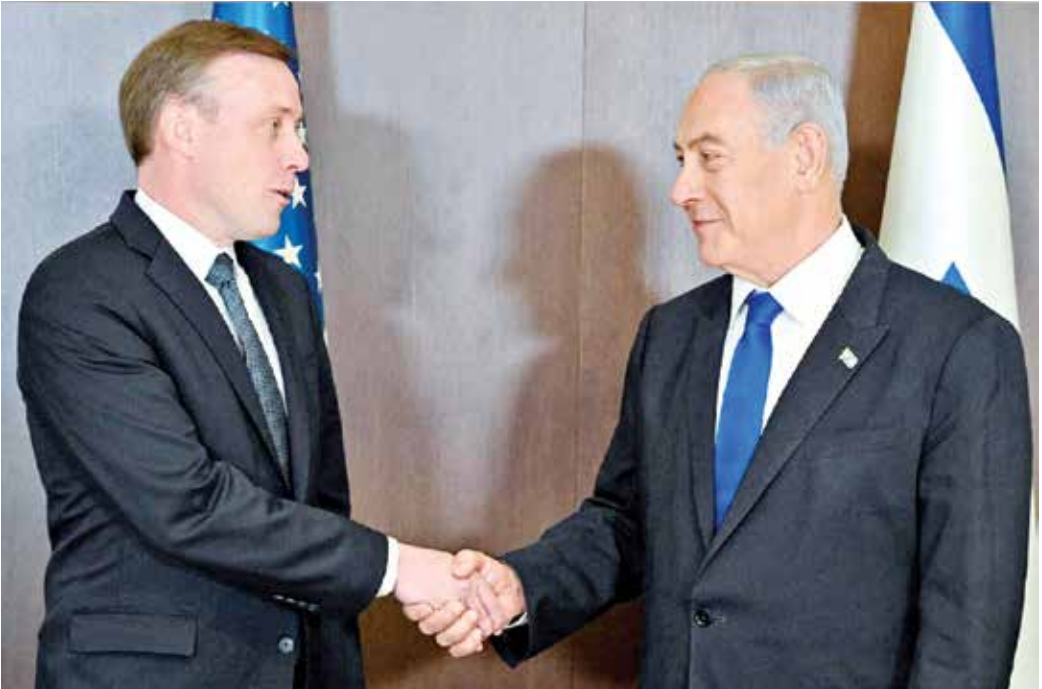
جیک سالیوان و بنیامین نتانیاهو

هنگی»، مشاور امنیت داخلی رژیم صهیونیستی اعلام کرد رژیم متبوعش امید زیادی به آن بسته تا بلکه گره از بن بست مناسبات تل آویو- رياض باز شود. در همین راستا رسانه منطقه‌ای «رای الیوم» در حالی که هدف «سالیوان» از این سفر را تلاش برای احیای پروژه تشکیل جبهه منطقه‌ای برای مقابله با جمهوری اسلامی ایران دانسته، این تلاش‌ها را نتیجه فهم جدید ایالات متحده از این واقعیت ارزیابی کرده و نوشته است: «امريکا، عربستان را به عنوان همپيمان سنتي و ۳۰ ساله خود از دست داده و در حال حاضر در تلاش است اين رابطه را ترميم کند؛ چرا که محمد بن سلمان به امريکا پشت کرد و به شرق يعني چين و روسيه گرايش