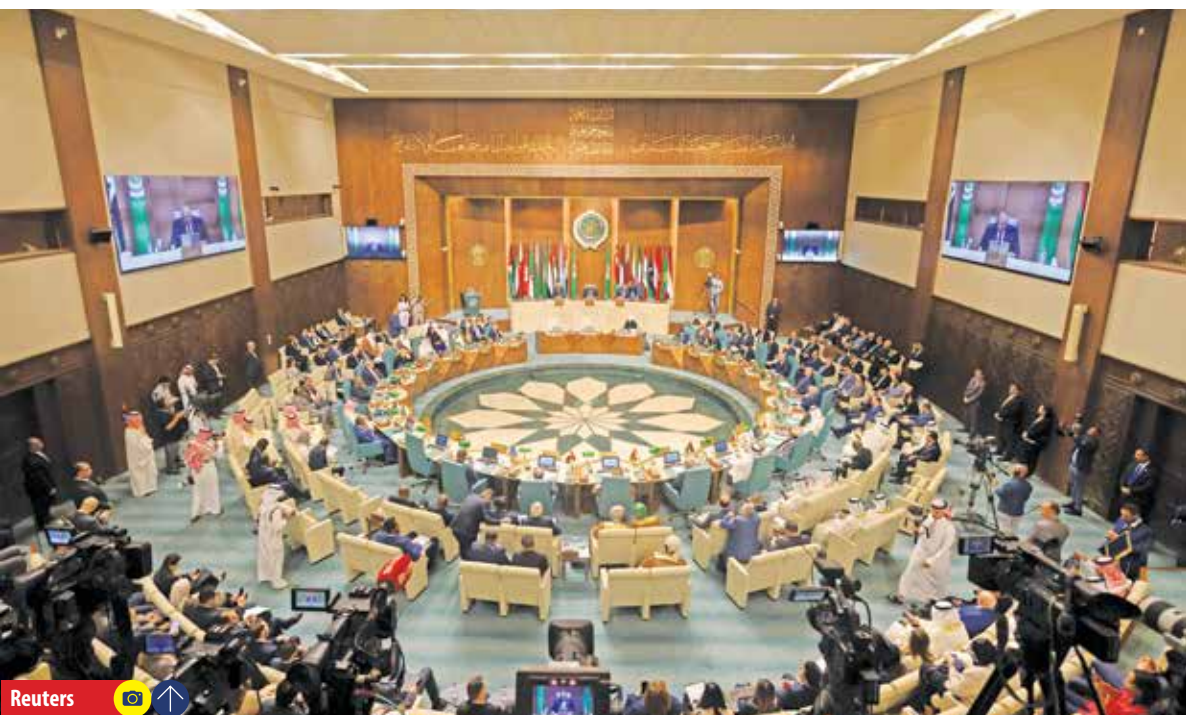
سرانجام بعد از چند هفته کش و قوس و مخالفت برخی اعضا با بازگشت سوریه به اتحادیه عرب و نشیمنهای محرمانه و غیر محرمانه عربستان با این کشورها، روز گذشته در نشست وزرای خارجه اتحادیه عرب در قاهره، اعضا به اتفاق آرا با بازگشت دمشق به جمع خود موافقت کردند. این در حالی است که دمشق در چند هفته اخیر بارها اعلام کرده،

بازگشت آن به اتحادیه عرب مشروط به پذیرش شرایط این کشور است. به گزارش سایت روزنامه الاهرام مصر، ظهر دپروز وزرای خارجه اتحادیه عرب در نشست قاهره پایتخت مصر با اکثریت آرا به بازگشت سوریه به این اتحادیه رای دادند. در همین ارتباط سایت شبکه خبری العربیه نیز از بازگشت سوریه پس از سال ها غیبت به آشوش عربی، خبر داد، همچنین اتحادیه عرب در بیانیه‌ای رسمی از موافقت کشورهای عضو با این مسأله خبر داد. در این بیانیه تأکید شده است، کشورهای عضو موافقت کردند همکاری‌های اتحادیه دمشق که با حضور وزرای خارجه اردن، عربستان، عراق، لبنان، مصر و دبیر کل اتحادیه عرب شده