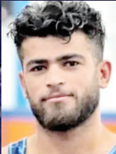
یکی از سربازان جان باخته

بی‌توجهی به جلو و خستگی و خواب آلودگی راننده اعلام کرد و گفت: بعد از اینکه خودرو با گاردریل برخورد کرده بر اثر شدت حادثه این خودرو واژگون و دچار حریق می‌شود که هر ۵ سرنشین خودرو در دم جان خود را از دست دادند.