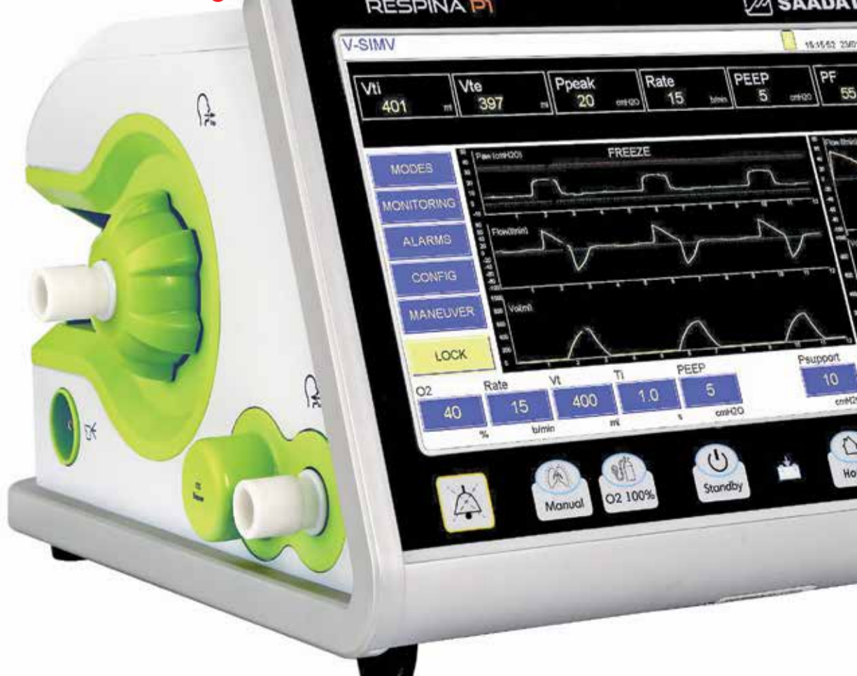
مانیتورینگ علائم حیاتی مدل Alvand H

مشکلات و موانع داخلی که بیشتر ناشی از دخالت دولت در سیاست‌های اقتصادی و مدل‌های قدیمی نظارتی است، اگر بیشتر نباشد، کمتر هم نیست