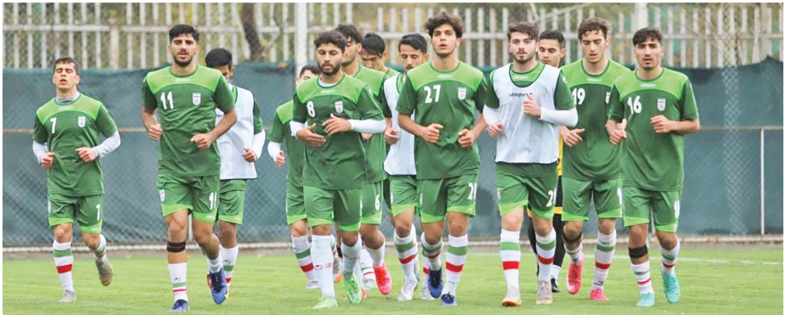
امیررضا همایون خبرنگار

مدت زمان اما به جای اینکه برای برگزاری اردوهای آماده‌سازی بگذرد به مصاحبه‌های گاه و بی‌گاه مسئولان فدراسیون فوتبال و شخص مهدی تاج برای زمان انتخاب سرمربی جدید این تیم گذشت. وعده‌هایی بی‌ثمری که تا همین الان هم ادامه دارد و مشخص نیست سرمربی جدید امیدهای فوتبال ایران برای حضور در تورنمنت‌های پیش رو چه زمانی انتخاب می‌شود.