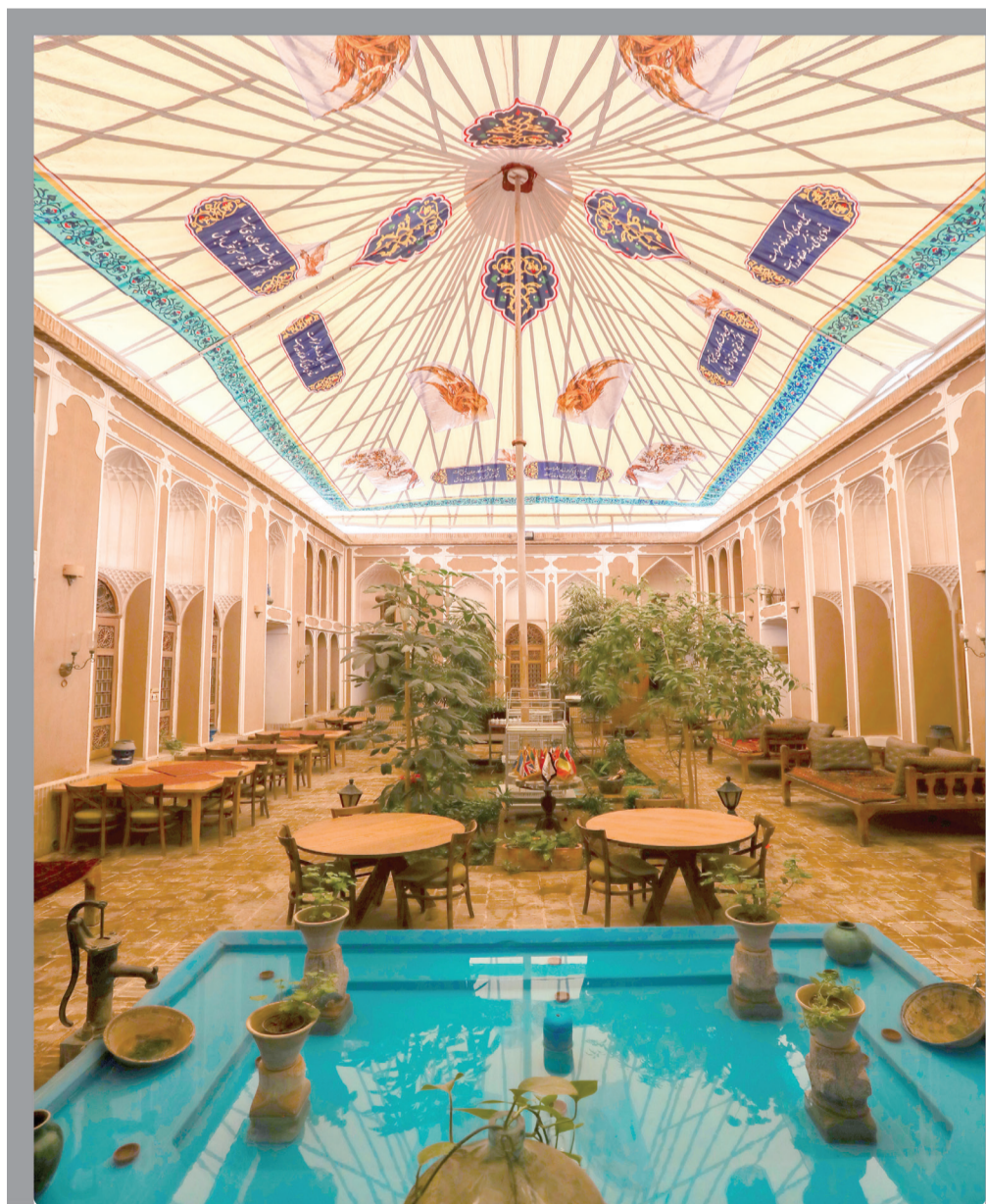
هتل‌های زنجیره‌ای مهر Mehrchainhotels.com