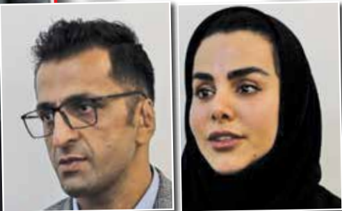
الهه خانم بدنساز

این کلاهبردار در پاسخ به این سؤال که در منزل شما یکسری مهر جعلی از ادارات دولتی