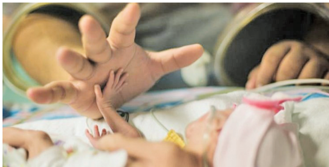
عکس تزئینی است