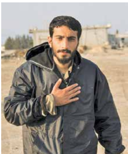
شهید مصطفی صدرزاده

با آغاز تعطیلات عید سعید فطر، بزرگ‌ترین موقوفه فرهنگی ایران در روزهای شنبه و یکشنبه (دوم و سوم اردیبهشت ۱۴۰۲) با تخفیف ویژه ۵۰ درصدی میزبان گردشگران بویژه تهران‌گردان در تالارهای موزه‌ای و نمایشگاه‌های این گنجینه خواهد بود. دوستداران فرهنگ و تاریخ می‌توانند در این روزها از تالارهای گوناگون موزه‌ای و آثار به‌نمایش درآمده که می‌سازند، در قیاس با آن شاهکار سال ۱۹۸۹ جزیره تورناوره ایتالیا فیلم بسیار بهتری نسبت به کار مندر است