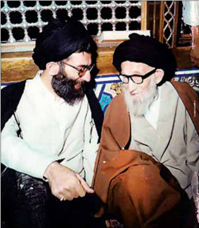
مقام معظم رهبری در کنار پدر بزرگوارشان آیت‌الله سیدجواد خامنه‌ای در آستان قدس رضوی ۱۳۵۸

نگاهی به کتاب شرح اسم درباره زندگی آیت‌الله سید علی خامنه‌ای