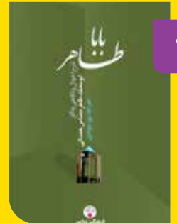
فرهنگ معاصر ۱۳۹۷

کتاب حاضر شرحی بر احوال و نگاهی به آثار «ابومحمد طاهر همدانی» است. این اثر با هدف روشن ساختن وجوه عرفانی و فلسفی زندگی و اشعار باباطاهر به رشته تحریر درآمده است. باباطاهر از چهره‌های معروف تصوف ایران است که تاکنون در هاله‌ای از ابهام به‌سر می‌برده است. وی در میان ایرانیان بیش از آن‌که به عنوان صوفی شناخته شود، به عنوان شاعر معروف بوده است.