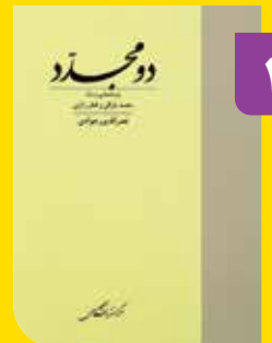
مرکز نشر دانشگاهی ۱۳۸۱

کتاب در هفت بخش تنظیم شده است. پنج بخش نخست درباره ابوحامد غزالی است و بخش شش و هفتم درباره فخر رازی. بخش اول از ۹ باب تشکیل شده است و هر باب شامل تصحیح اثر کوتاهی از غزالی است. این آثار به فارسی است به استثنای یکی که به عربی است. قبل از هر اثر، مقدمه‌ای از نگارنده آمده است.