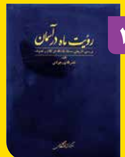
مرکز نشر دانشگاهی ۱۳۷۵

خواننده در این کتاب با تاریخ کلام و تصوف از ابتدا تا قرن هفتم هجری آشنا می‌شود و به بسیاری از جنبه‌های تاریخی عقاید دینی در اسلام، از جمله پیدایش تصوف و کلام، نهضت احمد بن حنبل و اهل حدیث، نقش و اهمیت حدیث در عقاید، مذهب عشق در تصوف، مسئله شهود و تجربه قلبی، استنباط صوفیه و خاصه معنای شوق، پی می‌برد.