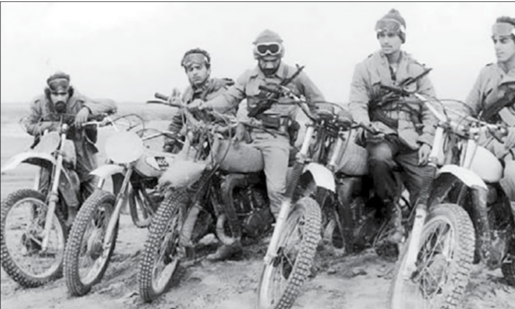
موتورسواران ستاد جنگ‌های نامنظم

کتاب حاضر شامل دست‌نگاشته‌های شهید چمران درباره حضرت علی (ع) و راز و نیازهای او به همراه سه سخنرانی است و سعی شده است در این کتاب از نگاهی دیگر به امام علی (ع) نگریسته شود و آن نگاه شهیدی است که از عاشقان دل‌سوخته علی است که همه عمر نام علی و یاد علی، روحیه‌بخش دردها و تنهایی او بوده است.