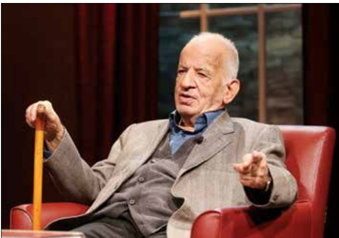
الهه غلامی پژوهشگر

درباره مهدی محقق و اندیشیدن به تفکر اسلامی