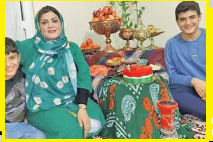
عادر و دو پسرش که قربانی پدر شده‌اند

زده به گزارش خبرنگار حوادث «ایران»، ساعت ۸ و ۳۰ دقیقه صبح دوشنبه ۲۱ فروردین ماه مردی با صورتی بهت زده و آرام وارد کلانتری رباط کریم شد و در یک جمله کوتاه اما شوک آور گفت: من همسر و دو پسر را کشتیم! این جمله کافی بود که افسر کلانتری گشت ویژه‌ای را به خانه این مرد در شهر پرند بفرستد. وقتی مأموران کلانتری به طبقه هفتم ساختمان رسیدند با صحنه دلخراش ۳ جسد غرق در خون روبه‌رو شدند.