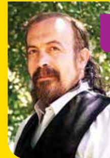
■ سیدحسین حسینی ■ شاعر اجتماعی

بی‌گمان شعرهای کوتاه «سیدحسین حسینی» از محیط اجتماعی پس از انقلاب تأثیر پذیرفته‌اند و این شاعر اندیشه‌ها و تجربه‌های اجتماعی خود را در شعر بازتاب داده است. شعر کوتاه به‌عنوان یک جریان ادبی مستقل در شعر بعد از انقلاب رشد کرده است و شاعران صاحب‌سبک دارد. اهمیت شعر کوتاه سیدحسین حسینی از آنجاست که این گونه شعری، در میان موج‌های شعری پس از انقلاب اسلامی، رشد زایدالوصفی پیدا کرده است.