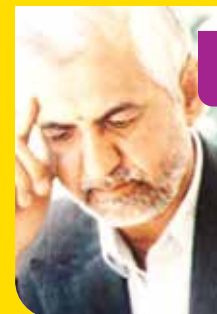
■ نصرالله مردانی ■ شاعر حماسی

«نصرالله مردانی» یکی از شاخص‌ترین شاعران حماسه‌سرای انقلاب اسلامی است. این شاعر متعهد و نام‌آور، با سروده‌های حماسی برجسته خود در دوران دفاع مقدس درخشید و با آفرینش آثاری چون «قیام نور» و «خون‌نامه خاک»، دین خود را به انقلاب و دفاع مقدس به شایسته‌ترین صورت ادا کرد. او به غزل که پیش از این صبغه‌ای غنایی داشت، با اوزان پرطننه، تصویرآفرینی‌های بدیع و ترکیب‌سازی‌های نو، هویتی حماسی بخشید و از ظرفیت‌ها و قابلیت‌های این قالب ادبی برای به تصویر کشیدن حماسه‌های دوران دفاع مقدس نهایت بهره را برد.