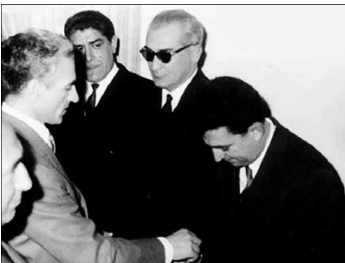
دیدار محمدرضا پهلوی با مئیر عزری

نگاهی به خاطرات ۲۰ سال حضور سفیر مخفی رژیم صهیونیستی در ایران