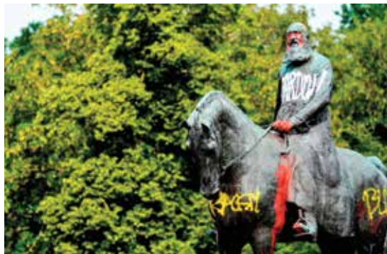
شعار نویسی در تظاهرات ضد نژادپرستی روی مجسمه لئوپولد دوم پادشاه سابق بلژیک در بروکسل

در آوریل ۱۸۸۴، هفت ماه قبل از کنفرانس برلین، ایالات متحده اولین کشور در جهان بود که ادعاهای پادشاه بلژیک لئوپولد دوم را در مورد قلمروهای حوزه کنگو به رسمیت شناخت.