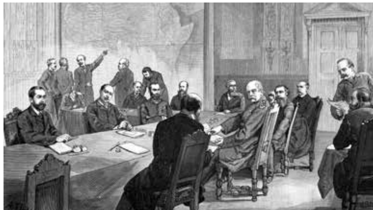
کنفرانس برلین نشستی بود میان قدرتهای اروپا که در برلین برپا شد و موضوع آن استعمار، بازرگانی و تقسیم آفریقا بود