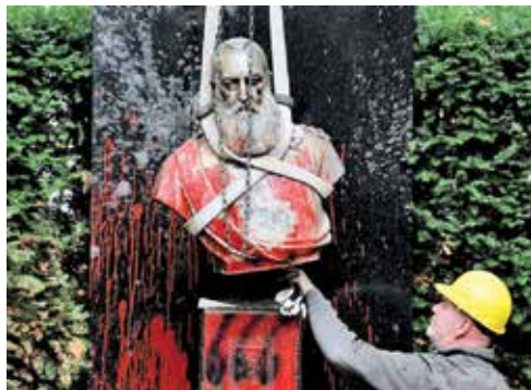
برچیدن مجسمه تخریب‌شده لئوپولد دوم پادشاه سابق بلژیک